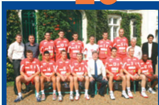
BOUC VOLLEY L'équipe officielle de la saison en cours